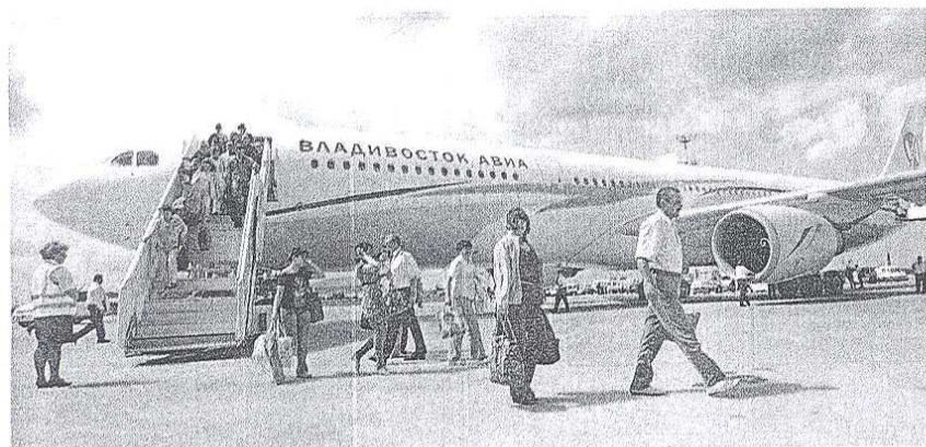
● Le marché européen, qui représente environ les trois quarts du volume de trafic aérien, a enregistré une hausse de 6,82%.

● Après un premier trimestre réussi, l'activité touristique poursuit sa dynamique en avril malgré l'entrée en vigueur de la taxe aérienne. Ces performances dopent le moral des professionnels avant la haute saison, qui coïncide une nouvelle fois avec le ramadan.