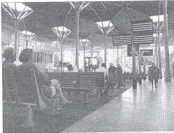
La nouvelle gare doit pouvoir accueillir 20 millions de passagers par an. Des milliers de voyageurs transitent chaque jour par Casa-Port, dont beaucoup effectuent des navettes entre Casablanca et Rabat notamment