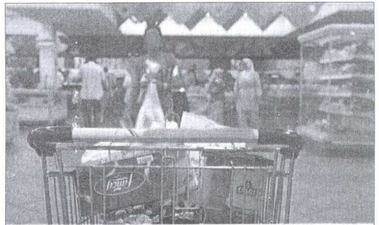
L'Etat joue encore à la temporisation pour certains produits sensibles encadrés tels que la farine et le gaz butane. Le caddy de la ménagère est déjà sous pression

le transport (taxi, autobus, véhicules de transport mixte) dans le giron des autorités locales. Des commissions préfectorale et provinciale seront instituées à cette fin. «D'autres produits et services devraient être concernés» par cette approche régionalisée de la réglementation des prix, selon une source autorisée au ministère des Affaires générales et de la Gouvernance. Le gouvernement s'apprête, justement, à