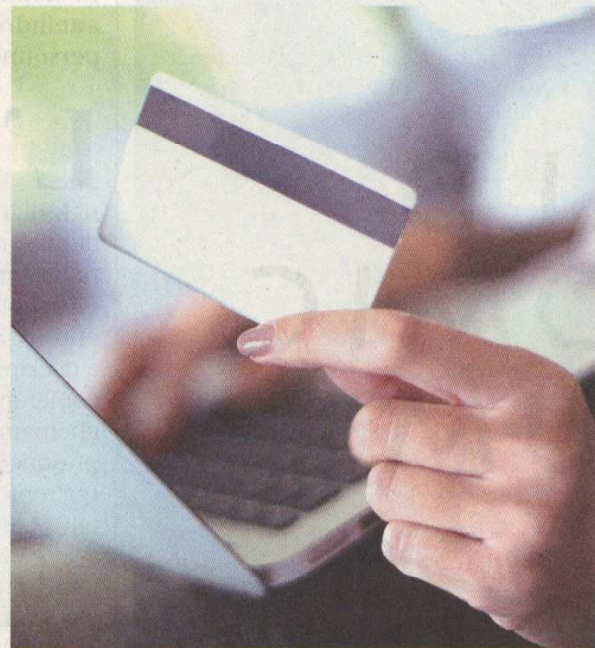
Le montant des achats en ligne a enregistré une performance de 1,33 milliard de dirhams, soit un bond de 12,4% sur un an.

Les réalisations globales de l'activité monétique ont atteint 240 milliards de DH.