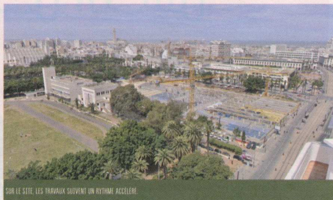
SUR LE SITE, LES TRAVAUX SUIVENT UN RYTHME ACCÉLÉRÉ.

Le projet de réhabilitation de ce parc version «New Age» prévoit aussi l'aménagement d'un parking souterrain d'une capacité de 750 places sur l'avenue Rachidi (place Nevada). La question de la sécurité reste très importante. Pour la simple raison que le fameux Parc de la ligue arabe a toujours fait parler de lui, notamment en termes d'insécurité. Aussi cette question a-t-elle été prise très au sérieux par les porteurs du projet. «Le nouveau parc dédié à la promenade et à la détente sera équipé de caméras de surveillance haute technologie. Elles seront installées sur l'ensemble du site, et des agents de sécurité seront recrutés pour assurer la sécurité des visiteurs», est-il souligné à ce sujet. Sur le volet de la conception, un cabinet d'études a été désigné en février 2015 pour prendre en charge les études paysagères, techniques et le suivi des travaux relatifs à ce parc. Ce marché de conception est évalué à 3 MDH. La Commune urbaine de Casablanca (maître d'ouvrage) y participe à hauteur de 45 MDH, la région du Grand Casablanca, quant à elle, y contribue à hauteur de 20 MDH contre 35 MDH de la Direction générale des collectivités locales.