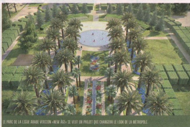
LE PARC DE LA LIGUE ARABE VERSION «NEW AGE» SE VEUT UN PROJET QUI CHANGERA LE LOOK DE LA MÉTROPOLIS.