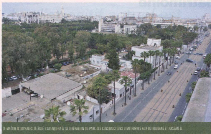
LE MAÎTRE D'OUVRAGES DÉLÈGUE S'ATTACHERA À LA LIBÉRATION DU PARC DES CONSTRUCTIONS LIMITROPHES AUX BO RoudANI ET HASSAN II.

effet, de pouvoir convaincre les gens de libérer les lieux. «Tout dépend en fait des négociations avec les propriétaires de ces bâtiments», soulignent des sources proches du dossier. Celles-ci reconnaissent que les négociations, par exemple, avec le club du basket du Widad et du CMC étaient très difficiles. Cependant, le problème aura finalement été débloqué. Selon les mêmes sources, la décision a été prise de proposer au club de Widad un terrain au niveau de l'arrondissement Mers-Sultan-Al Fida. Quant au CMC, l'alternative serait de le déplacer soit au complexe Al Amal, soit vers l'arrondissement Al Fida, est-il indiqué.