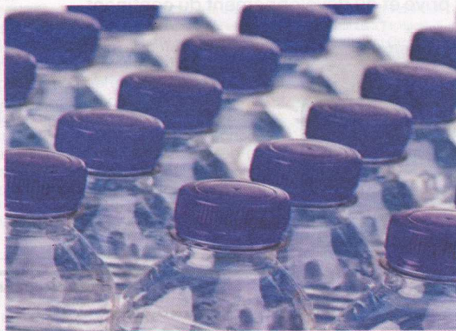
ÉVOLUTION DU MARCHÉ DES EAUX