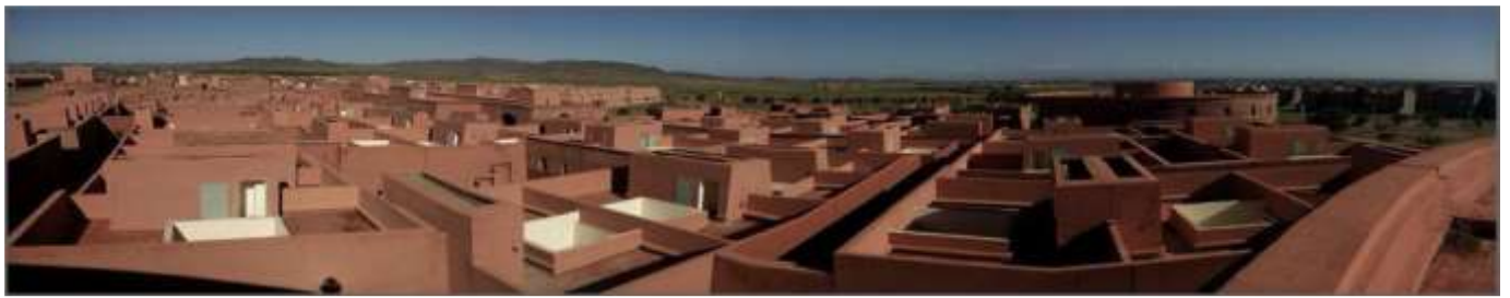
Vue d'un roof top sur la ville de Tamansourt

Les contraintes physiques de la ville en font un lieu favorable au développement de technologies innovantes autour des énergies renouvelables, de l'eau et des déchets. Intégrer par exemple des systèmes de récupération et de recyclage des eaux usées et pluviales réduira la consommation