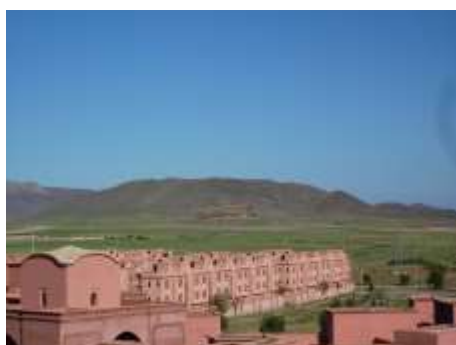
mercredi 27 juillet 2016

est aujourd'hui souvent décrite comme une ville fantôme . En effet malgré les énormes efforts de la société Al-Omrane, qui ont permis la construction de 80 % des logements prévus, 4 écoles primaires, 2 collèges et 2 lycées, la ville ne compte que 55 000 habitants avec un taux de vacance proche de 50 %. Le maillon faible de Tamansourt semble être un manque d'équipements publics et de services (banque, administration, hôpital...) ainsi que l'insuffisance de l'offre de transport urbain : Tamansourt est desservie par une seule ligne de bus à partir de Bâb Doukkala à Marrakech et avec une fréquence d'un bus par heure. Pourtant le site de Tamansourt présente un très grand potentiel environnemental grâce à sa topographie plate, ses larges voiries, un plan de mobilité douce (marche, vélo) et une réserve foncière importante. Son taux d'ensoleillement élevé (340j/an), et sa pluviométrie faible (250mm/an) en font cependant un site relativement aride.