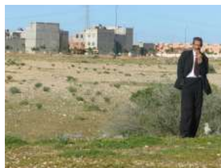
MSIUS Maroc 2015-2016