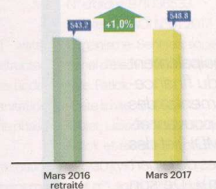
PRODUIT NET PART DU GROUPE (EN MDH)