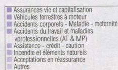
RÉPARTITION DES ÉMISSIONS D'ASSURANCES PAR SOUS-CATÉGORIES

● ● ● La progression annuelle moyenne des primes est de 6,17%.