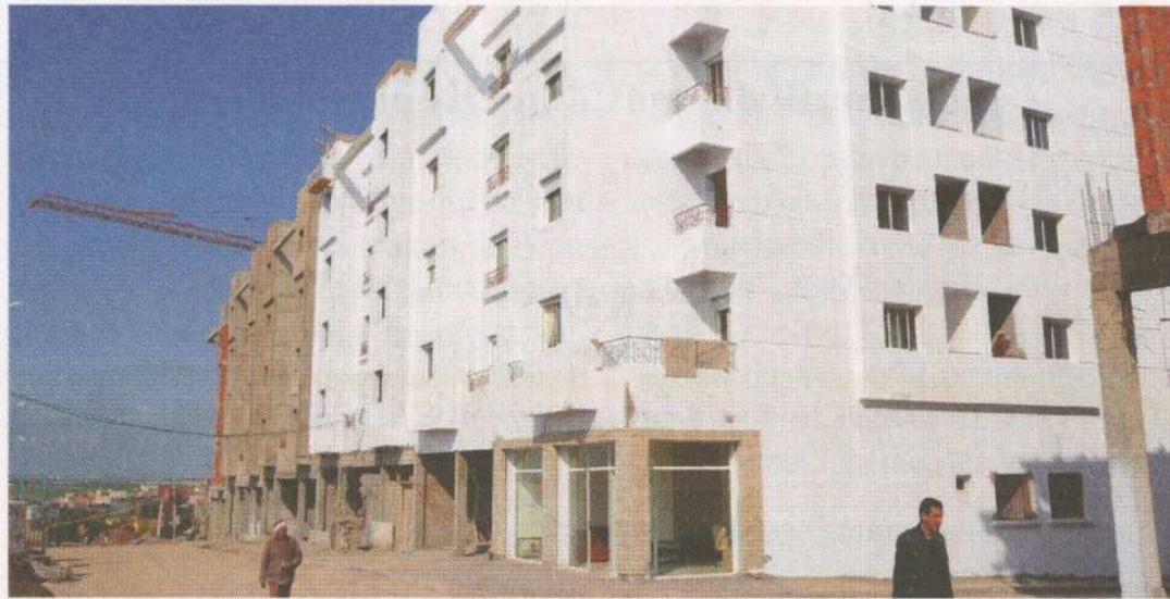
Pour relancer l'immobilier, il va falloir impérativement revoir le dispositif du logement social et celui de la classe moyenne et surtout assurer une adéquation entre l'offre et la demande

Chez quasiment tous les promoteurs, il y a de fortes inquiétudes sur les méventes et les volumes de stocks d'invendus malgré la baisse des taux d'intérêt bancaires. En effet, d'importants stocks sont un peu