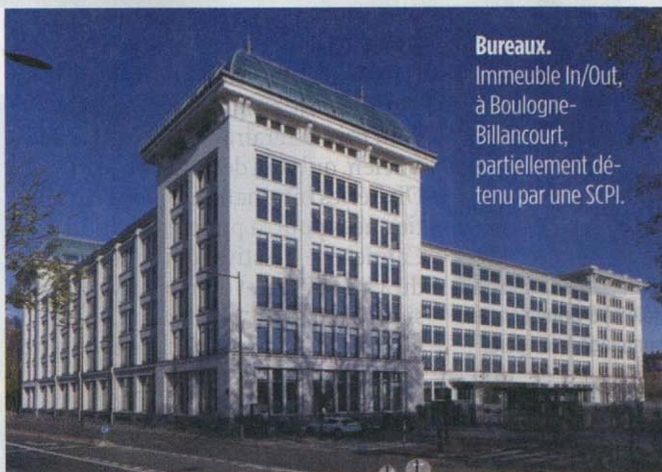
Bureaux. Immeuble In/Out, à Boulogne-Billancourt, partiellement détenu par une SCPI.

EN 2017, LES SCPI SPÉCIALISÉES ONT ÉTÉ LES PLUS GÉNÉREUSES : 4,91 % DE TAUX MOYEN.