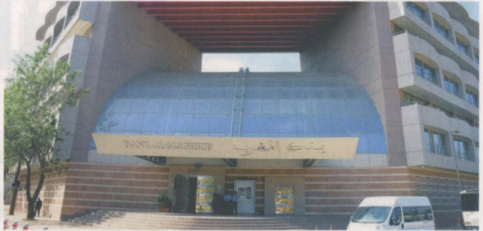
Les crédits à l'équipement se sont bien comportés au cours des deux premiers mois de 2018, s'accroissant de 11% à 169,714 milliards de DH, selon la Banque centrale.

Le financement de l'économie par le crédit bancaire se ressaisit. Il regagne progressivement le terrain perdu au cours des derniers mois de l'année écoulée. En effet, après avoir terminé 2017 sur une décélération à 2,9% en rythme annuel, la distribution des crédits bancaires a affiché une croissance de 3,2% en janvier 2018 avant de s'accroître à 3,9% à fin février dernier, avec un encours de 824,145 milliards de DH, selon les dernières statistiques monétaires de Bank Al-Maghrib (BAM). À rappeler que le crédit bancaire avait atteint un pic de 6,2% en juin dernier, avant de commencer à ralentir au second semestre 2017. La hausse observée à fin février 2018 résulte notamment de la poursuite de l'embellie des prêts à l'équipement qui ont crû de 11% à 169,714 milliards, loin devant les autres segments du