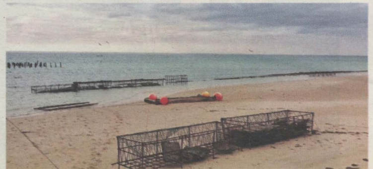
L'industrie de la pêche dans la région concentre 1,25 milliard de DH. Actuellement, une quinzaine de projets aquacoles existent, mais se concentrent essentiellement dans la baie de Dakhla, sur les sites de Boutalha et Duna Blanca. L'activité se base sur la conchyliculture, en particulier pour l'élevage des huîtres

rement à Dakhla qui, hormis le tourisme et la pêche, secteurs de prédilection, mise aussi sur les services. C'est la tendance qui se dégage des investissements consentis en 2017, avec une augmentation de 275% par rapport à l'année précédente. Dans le détail, ce sont 394 projets qui ont été approuvés pour un montant de plus de 6 milliards de DH. Une manne financière qui devait permettre la création de 13.142 emplois! Sans surprise, la plus grosse part émane du tourisme qui accapare ainsi 37% du montant d'investissement global