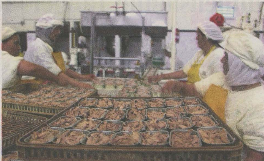
Plusieurs activités sont admises dans la ZFED. Parmi elles, les activités commerciales rattachées aux industries agroalimentaires et des produits de mer pour lesquels la région se prête à merveille

LA ville de Dakhla dispose d'une zone franche d'exportation (ZFED) lui permettant de se positionner par rapport aux autres zones portuaires nationales. De par sa proximité des ressources halieutiques de la région, l'existence de voies de transport maritime, aérienne et terrestre faciles d'accès, la ville offre un avantage énorme en matière d'exportation, mais surtout en fiscalité. Ainsi, les opérations commerciales, industrielles et de services, réalisées avec l'étranger par les entreprises installées dans la ZFED, bénéficient d'une liberté totale de change quels que soient la nationalité et le lieu de résidence de l'opérateur. En outre,