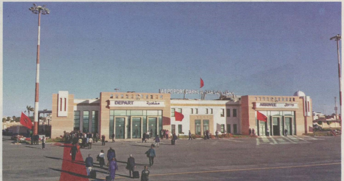
Tapis rouge pour les investisseurs dans les provinces du Sud. Mais le décollage économique indéniable que connaît la région, avec ses secteurs phares tourisme et pêche, pose également des défis: celui de l'accompagnement de cette dynamique afin de pérenniser les investissements

AFIN de créer une dynamique économique dans la région de Dakhla-Oued-Dahab, des mesures fiscales ont été mises en place pour encourager les investisseurs aussi bien pour la création d'entreprises que pendant l'exploitation de leurs projets. Droits d'enregistrement, droits de douane, TVA, taxe urbaine, impôts des patentes, Participation à la solidarité nationale (PSN), IS et IGR, toutes ces taxes, entre autres, bénéficient soit d'une exonération totale, soit d'un taux préférentiel. Les entreprises ayant un programme d'investissement qui répond à certains critères relatifs au montant de l'investissement, le nombre d'emplois stables à créer, le transfert de technologie et la contribution à la protection de l'environnement, peuvent conclure des contrats particuliers avec l'Etat. Ceux-ci leur permettent de bénéficier d'une exonération partielle sur les dépenses d'acquisition du terrain, des dépenses d'infrastructures hors site et des frais de la formation professionnelle. En outre, les entreprises ont la possibilité de constituer une provision annuelle pour