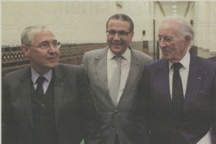
L'accord entre le ministère des Finances et les banques en janvier dernier va permettre d'apurer le stock de crédit TVA en attendant une réforme qui viendrait corriger les anomalies de cet impôt

UNE multitude de taux, des entreprises qui achètent à un taux et vendent à un autre, l'Etat qui consomme la recette de la TVA sachant qu'il doit la restituer... Ce capharnaüm aboutit à une facture (crédits TVA) de 14,2 milliards de DH dus aux entreprises privées et qui assèchent leur trésorerie. Mais, les choses se décaignent depuis que le ministère des Finances et les banques ont conclu un accord pour l'apurement du stock. Cependant, le mal n'a pas