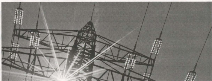
La production appelée nette locale d'électricité a progressé de 6,7% et la consommation a reculé de 2,6% à fin août 2018.

Pour ce qui est de la consommation d'électricité, elle a reculé de 2,6% à fin août dernier, contre +4,3% durant la même période de l'année écoulée. Ce recul a touché essentiellement la consommation d'électricité très haute tension et haute tension qui a chuté de 15,8%, alors que la moyenne tension a régressé de 1,4%. Pour