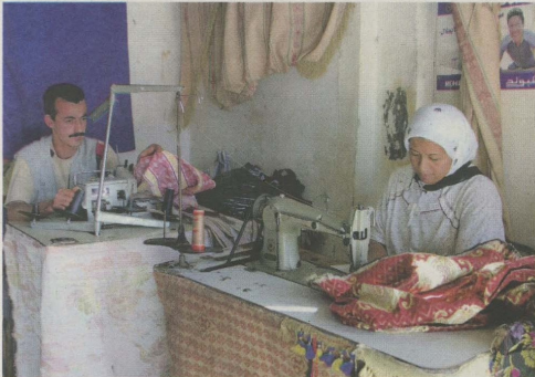
Malgré des taux d'intérêt relativement élevés, les remboursements du microcrédit restent corrects comparés au crédit bancaire. Le taux de créance en souffrance s'est établi à 3,3% en 2017. Il se situe à 9,4% pour les sociétés de financement et à 7,5% pour les banques

connaître une nouvelle impulsion avec le relèvement du plafond de prêt de 50.000 à 150.000 DH. Cette évolution permettra aux associations de couvrir une population d'entreprises qui ne peut s'adresser