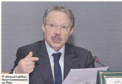
Ahmed Lahlimi, Haut-Commissaire au Plan

Au titre du 3 e trimestre 2018, la production de l'industrie manufacturière aurait connu une légère hausse, résultat d'une augmentation de la production dans les branches de l'industrie chimique, de la fabrication de boissons et de la Métallurgie et d'une baisse de la production dans les branches de la fabrication d'autres produits minéraux non métalliques. En effet, les carnets de commandes sont estimés d'un niveau normal par les chefs d'entreprises. S'agissant de l'emploi, il aurait connu une stabilité. Globalement, le taux d'utilisation des capacités de production (TUC) se serait établi à 79%. En ce qui concerne la production de l'industrie extractive, elle aurait affiché une stabilité imputable à une stagnation de la production d'autres industries extractives. La production de l'industrie énergétique aurait connu, quant à elle, une augmentation due principalement à la hausse de la production et distribution d'électricité, de gaz, de vapeur et d'air conditionné. S'agissant des carnets de commandes, ils sont jugés d'un niveau normal. L'emploi, quant à lui, aurait connu une augmentation. Dans ces conditions, le TUC dans l'industrie énergétique se serait établi à 93%. La production de l'industrie environnementale e aurait enregistré une augmentation imputable à une hausse de l'activité de Captage, traitement et distribution