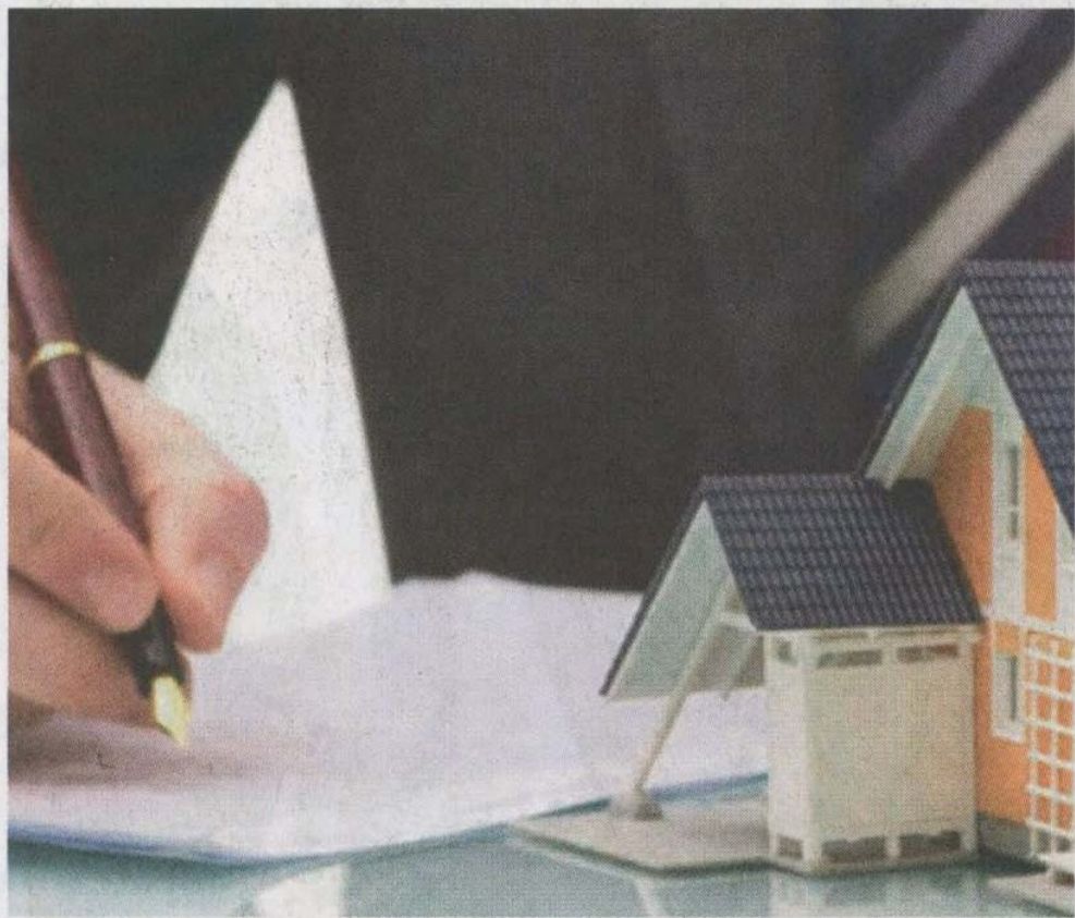
5% des ménages interrogés pensent acheter un logement au cours des 12 prochains mois.