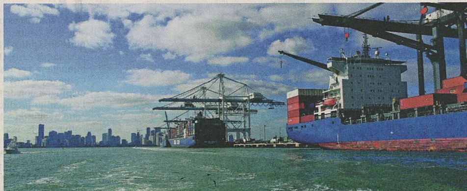
Le dernier baromètre du commerce des marchandises indique une croissance inférieure à la moyenne, relève l'OMC.

De ce fait, font remarquer les auteurs du document, les données officielles confirment la «perte de dynamisme» du commerce des biens prévue par le Baromètre du commerce des biens plus tôt cette année. En effet, selon les dernières statistiques trimestrielles sur le volume des échanges de l'OMC, le commerce de marchandises n'a augmenté que de 0,2% en un an au deuxième trimestre 2019, contre