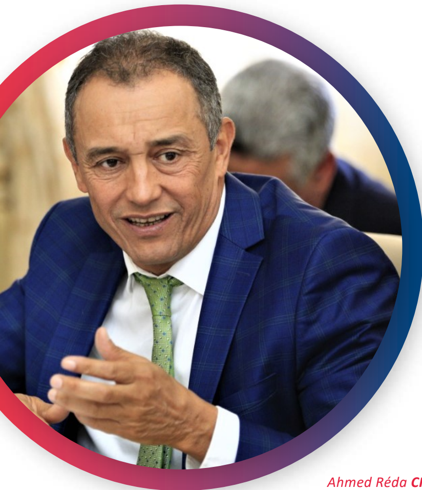
Ahmed Réda CHAMI Président du Conseil Économique, Social et Environnemental (CESE)