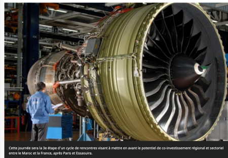
Cette journée sera la 3 e étape d'un cycle de rencontres visant à mettre en avant le potentiel de co-investissement régional et sectoriel entre le Maroc et la France, après Paris et Essouira.

La Chambre française de commerce et d'industrie du Maroc (CFCIM) organise la 3 e édition des journées économiques Maroc-France à Toulouse qui se tiendra du 23 au 25 mars à la Cité de l'espace à Toulouse sur le thème «L'aéronautique, un secteur prioritaire du Plan d'accélération industrielle au Maroc». Et ce sous l'égide du ministère de l'Industrie et du commerce et en partenariat avec l'Ambassade du Royaume du Maroc en France, l'Agence marocaine de développement des investissements et des exportations (AMDI), la CCI Occitanie et le Groupement des industries marocaines aéronautiques et spatiales (GIMAS). Cette journée sera la 3 e étape d'un cycle de rencontres visant à mettre en avant le potentiel de co-investissement régional et sectoriel entre le Maroc et la France, après Paris et Essouira.