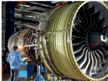
Cette journée sera la 3 e étape d'un cycle de rencontres visant à mettre en avant le potentiel de co-investissement régional et sectoriel entre le Maroc et la France, après Paris et Essaouira.

Elle sera focalisée sur l'aéronautique marocaine La 3 e édition des Journées économiques Maroc-France à Toulouse du 23 au 25 mars