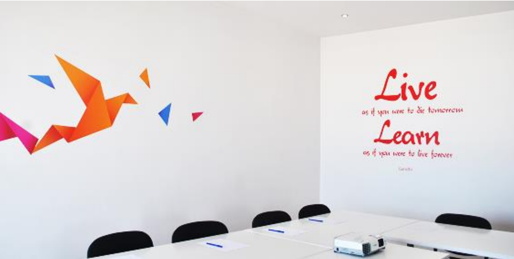
[Notre salle de formation à Casablanca]